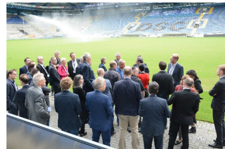
Impressionen vergangener IHK-Begegnungstage